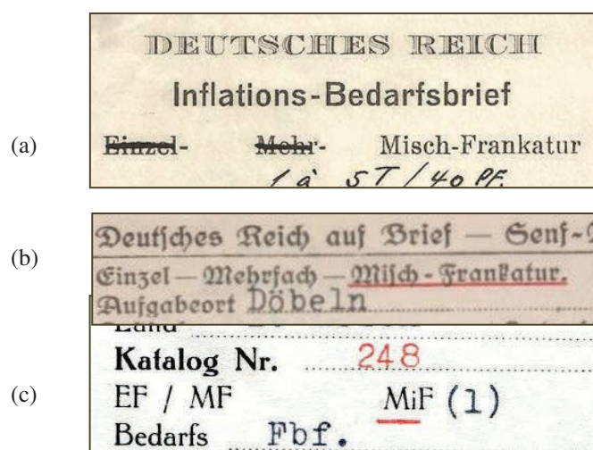
Abb. 2 Vergrößerte Ausschnitte aus den BZ von Hirsch (a), Peschl (b) und Sieber (c)

Der anonyme Zettel (Abb. 1) sollte, so entnimmt man der obersten Zeile, bei den Sammelgebieten Deutsches Reich und Saargebiet eingesetzt werden. Wegen der engen Anbindung an Frankreich blieb der saarländischen Bevölkerung die Hochinflation erspart. Besonders aktuell wurde die Saar-Thematik in der Zeit vor der Volksabstimmung am 13. Januar 1935, bei der es um die Wiedereingliederung ins Deutsche Reich ging. Denkbar also, dass der Zettel um diese Zeit entstanden ist.