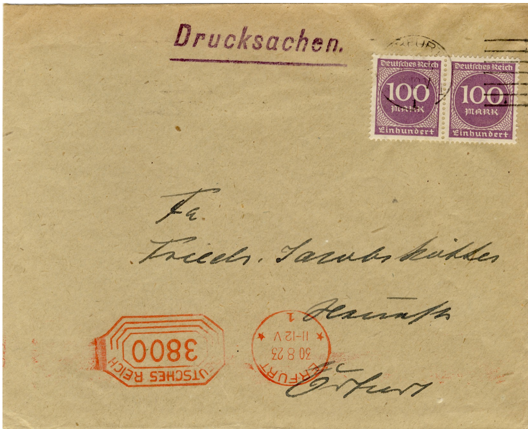
Teilbarfrankatur mit Maschinen-Postfreistempel