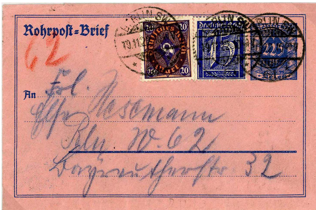
Abb.2: Brief portogerecht auf frankiert mit 20,75 M, MiNr.:158+230 auf Rohrpost-Ganzsache über 225 Pf. MiNr. RU 10 vom April 1921, = 23 M, mit Minuten-Stpl. Berlin SW 19.11.22, 10 40 V, rückseitig Minuten-Stpl. Berlin W 19.11.22, 11 10 V. und Briefträger-Stpl. Nr. 22

Die Rohrpost diente ausschließlich der Beförderung von Eilnachrichten wie Postkarten, Briefen und Telegrammen und unterlag eigenen Posttarifen.