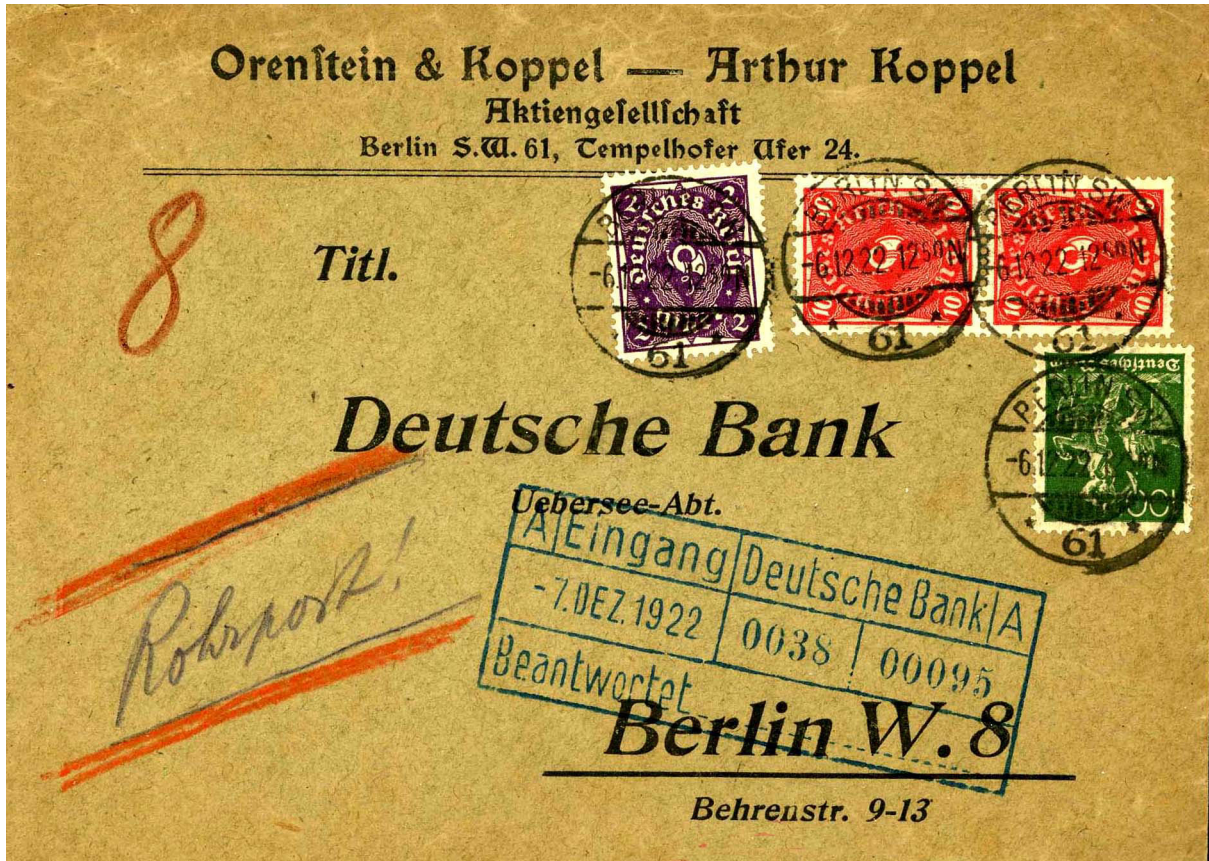
Abb.3: Brief (Privatumschlag) aus der gleichen Porto-Periode und Porto mit MiNr. 167, 171+ 2 x 175 von 23 M wie vor, mit Minutenstempel Berlin SW vom 6.12.22, 12 50 N und rückseitigem Ankunftsstempel Berlin W, 6.12.22, 1 10 N sowie unleserlicher achteckiger Briefträgerstempel

diese bereits kurz nach Erscheinen das Porto nicht mehr abdeckten und nur mit zusätzliche Frankatur verwendet werden konnten (Abb.2). Bei den ebenfalls zugelassenen Privatumschlägen in DIN A6 für Briefe bis 20g (Abb.3), musste deutlich auf der Vorderseite der Vermerk „Rohrpost“ angegeben werden. Handschriftliche postalische Vermerke erfolgten in der Inflationszeit in der Farbe rot bis rot-braun.