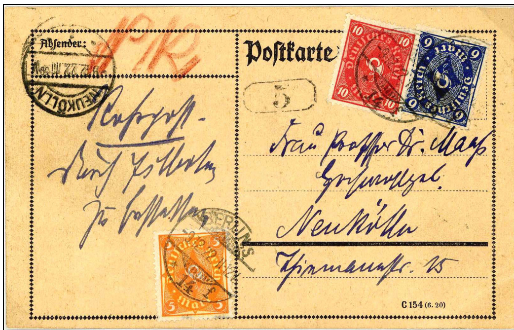
Abb.5: Periode 10, Karte vom 9.12.22, 11-12 V, Berlin S nach Neukölln mit Porto 21 M, MiNr.205, 206, 228, mit vorderseitigem Minuten-Ankunftstempel 9.12.22, 11 50 V und Briefträgerstempel Nr. „5“.