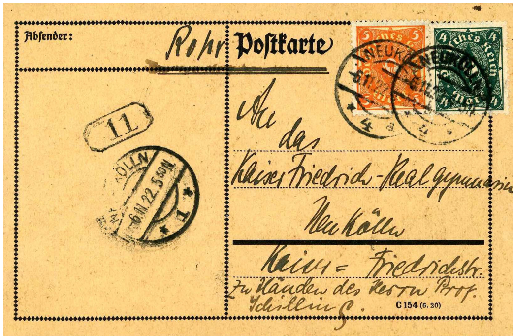
Abb.4: Periode 9, Karte vom 6.11.22, 4-5N innerhalb Berlin-Neukölln, mit Porto 9 M, MiNr. 173+205, mit vorderseitigem Minuten-Ankunftstempel 6.11.22, 5 50 N und Briefträgerstempel Nr. „11“