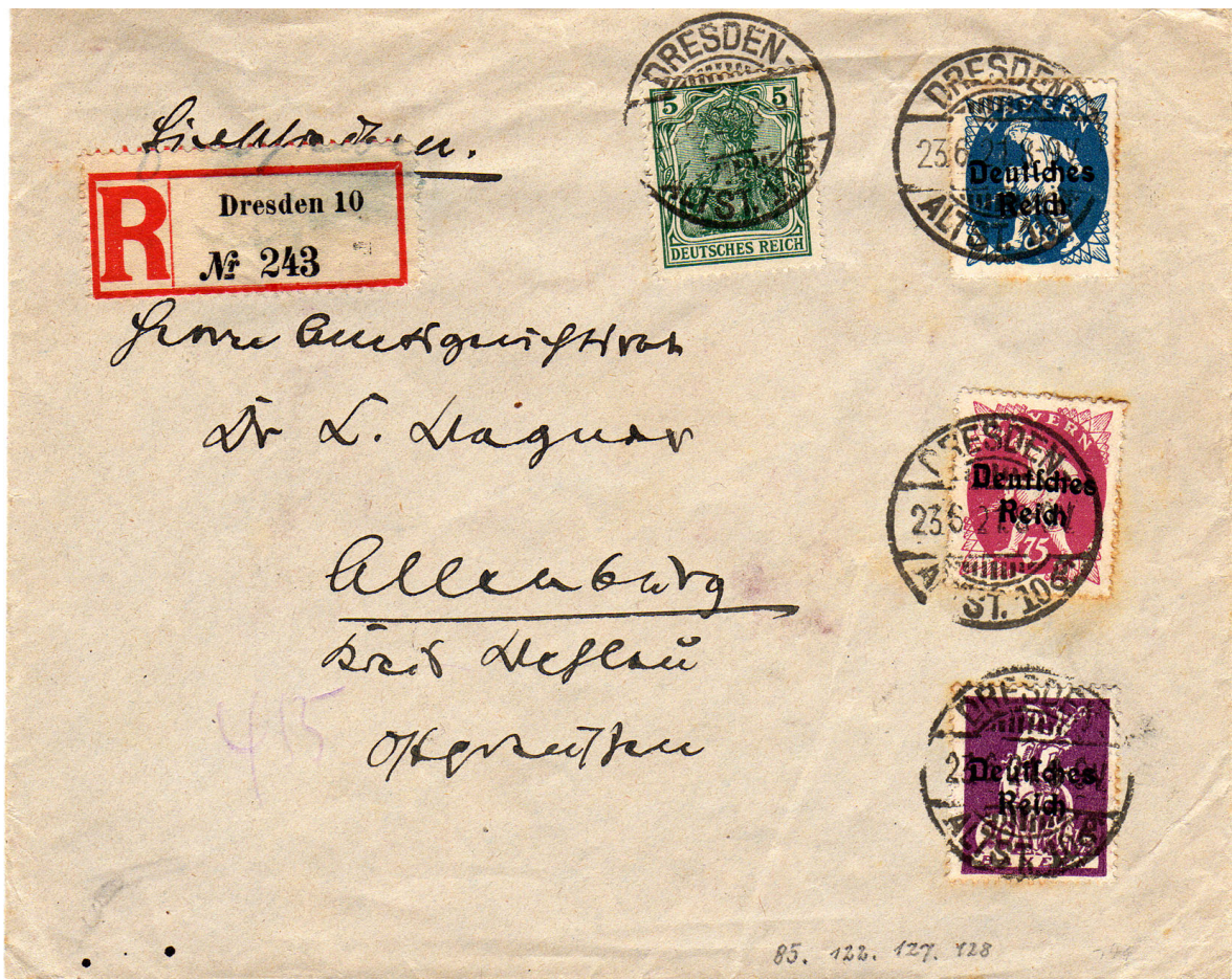
23.6.1921, PP 6, Fernbrief bis 100g, Porto 80 Pf. + Einschreibengebühr 1 Mark