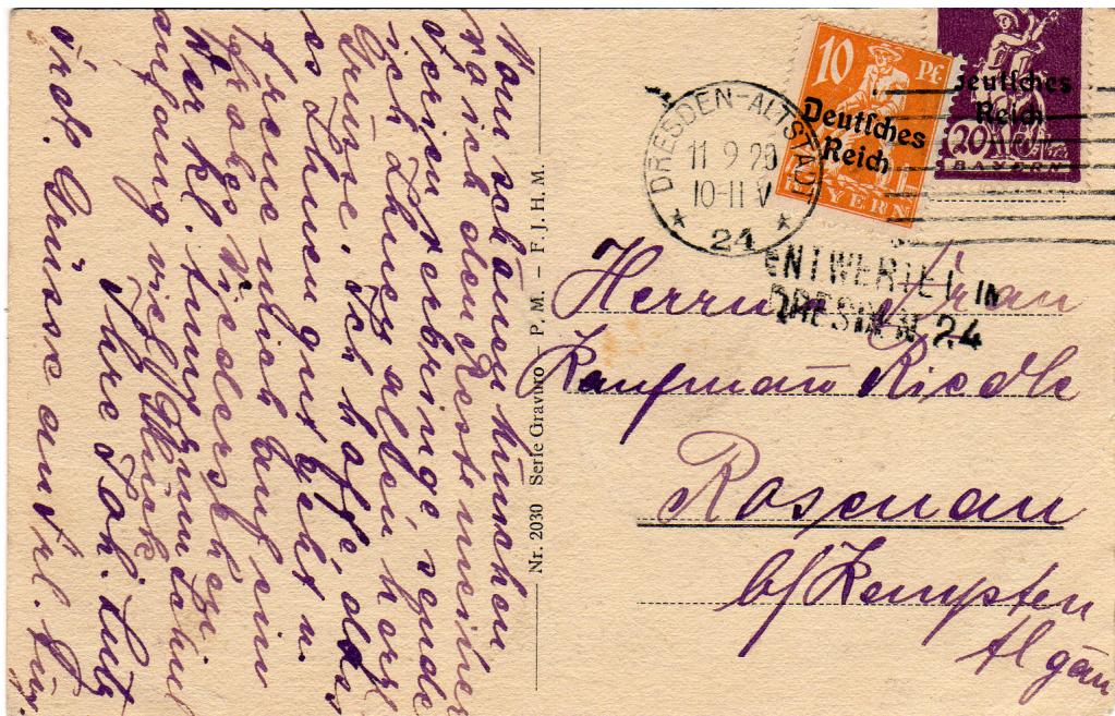
11.9.1920 (PP 5) MiF 120+122, Fernpostkarte, Porto 30 Pf.