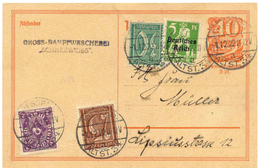
1.12.1922, PP 10, Fernpostkarte, Porto 3 Mark (siehe Beitrag Seite 13 ff)