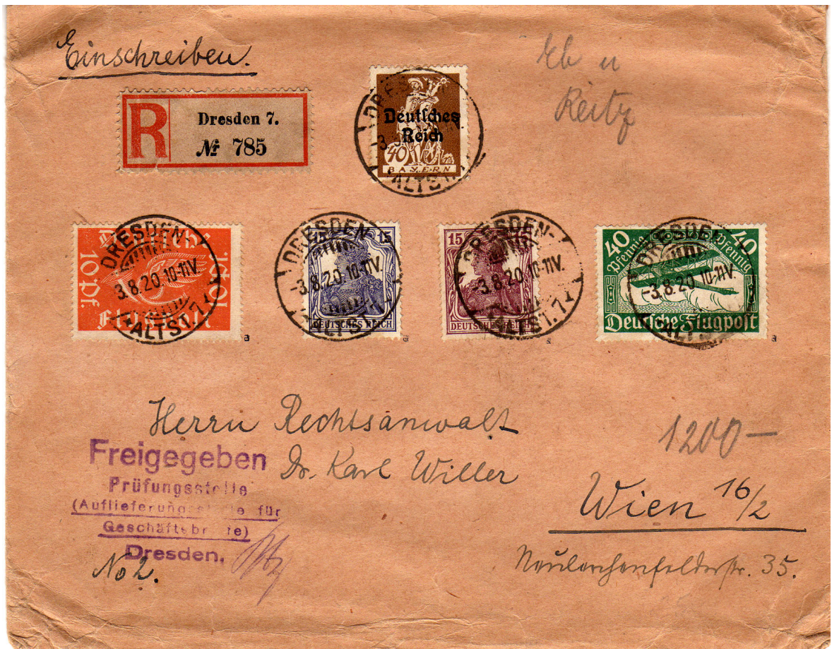
3.8.1920 (PP 5) Porto 60 Pf. + Einschreibengebühr 50 Pf. (10 Pf. überfrankiert)