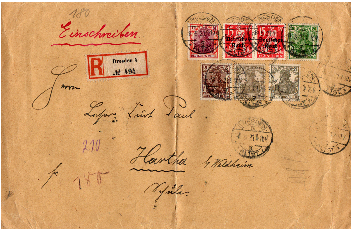
8.5.1921, PP 6, Fernbrief bis 100g, Porto 80 Pf + Einschreibengeb. 1 Mark (4½ Pf überfrankiert)