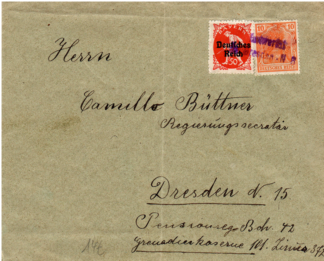
undatierter Brief, PP 5 oder 6, MiF 125+141, Ortsbrief bis 100g, Porto 60 Pf.