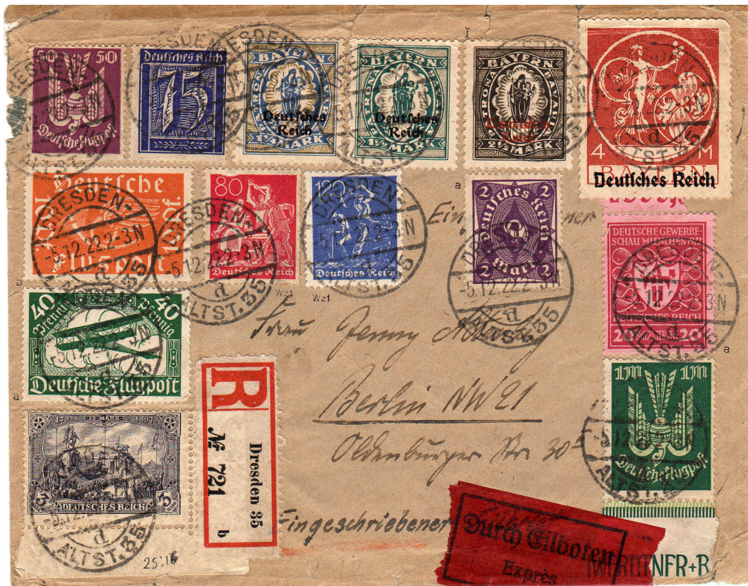
5.12.1922, PP 10, Fernbrief bis 100g, Porto 16 Mark + Einschreibengebühr 8 Mark + Eilzustellung 15 Mark

Weitere Abbildungen befinden sich auf der letzten Umschlagseite. Über Meldungen weiterer Belege aus Dresden würde ich mich sehr freuen und sie in einem weiteren Nachtrag vorstellen.