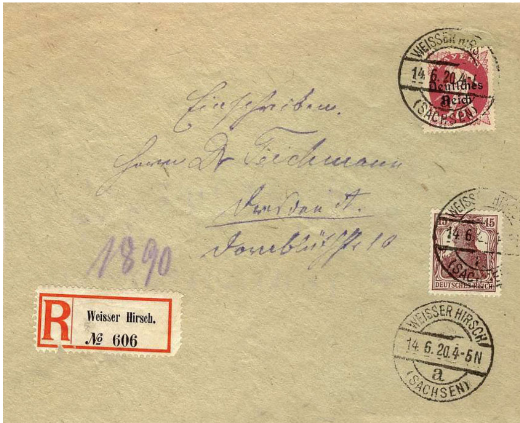
14.6.1920 (PP 5) MiF 127 + 142, Porto 40 Pf. + Einschreibengebühr 50 Pf.