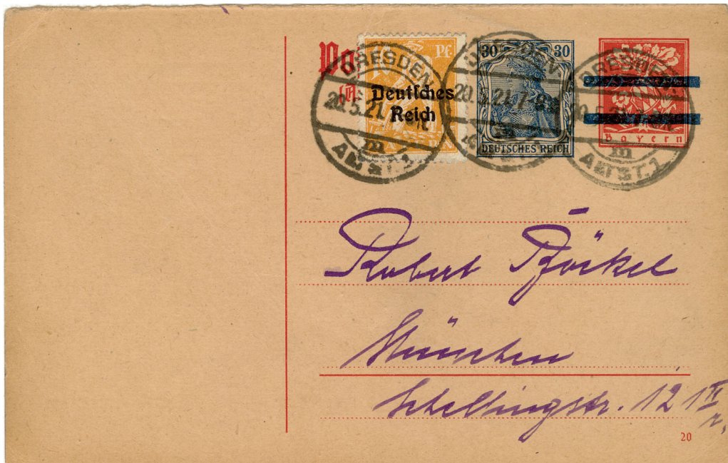
20.5.1921, PP 6, Fernpostkarte, Porto 40 Pf.