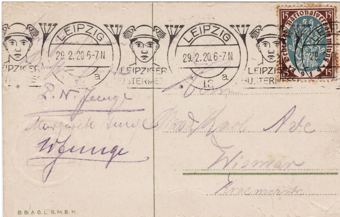
Fernpostkarte, 108, 29.2.1920

Hier eine Postkarte aus Leipzig mit dem Werbestempel der Leipziger Mustermesse, dreiköpfige Bandstempelmaschine mit schmalem Einsatz: