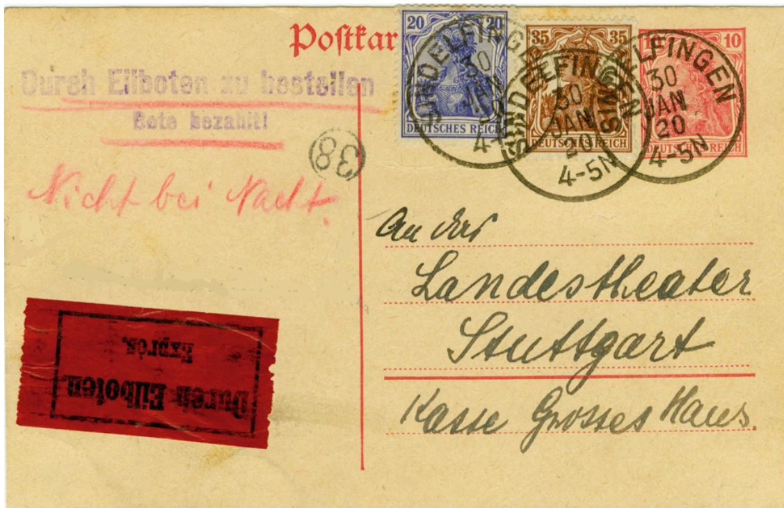
Eil-Fernpostkarte, P 107 + 87 II + 103, 30.1.1920

Nachfolgend eine Buntfrankatur mit MiNr. 103 und 87 auf Ganzsachen-Postkarte P 107. Porto 15 Pf. plus Eilzustellgebühr 50 Pf.