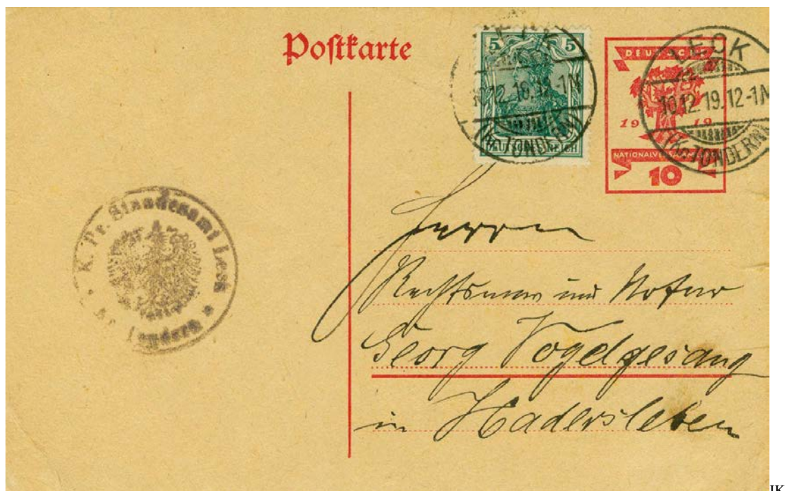
Fernpostkarte, P 115 + 85 II, 10.12.1919