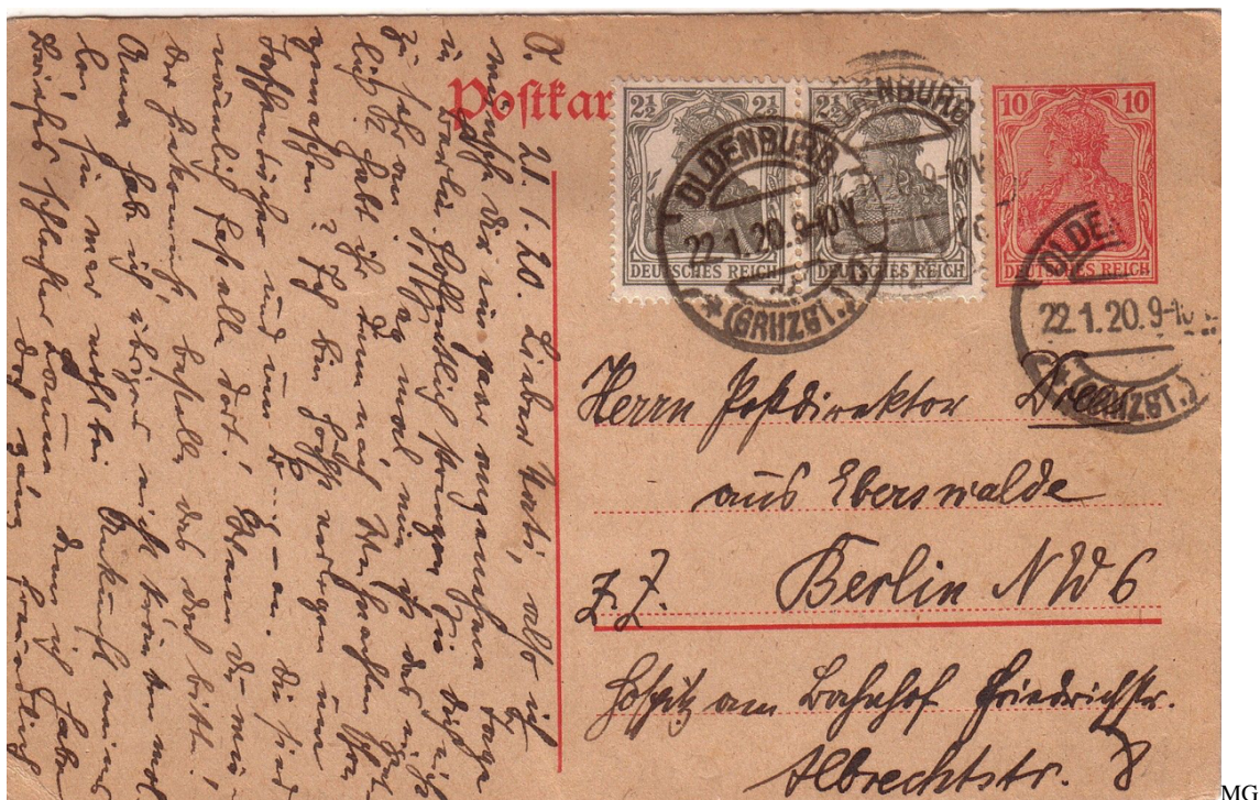
Fernpostkarte, P 107 + 2x98, 22.1.1920

Nachfolgend einige Möglichkeiten, wie man die 15 Pf. für das Porto realisieren konnte.