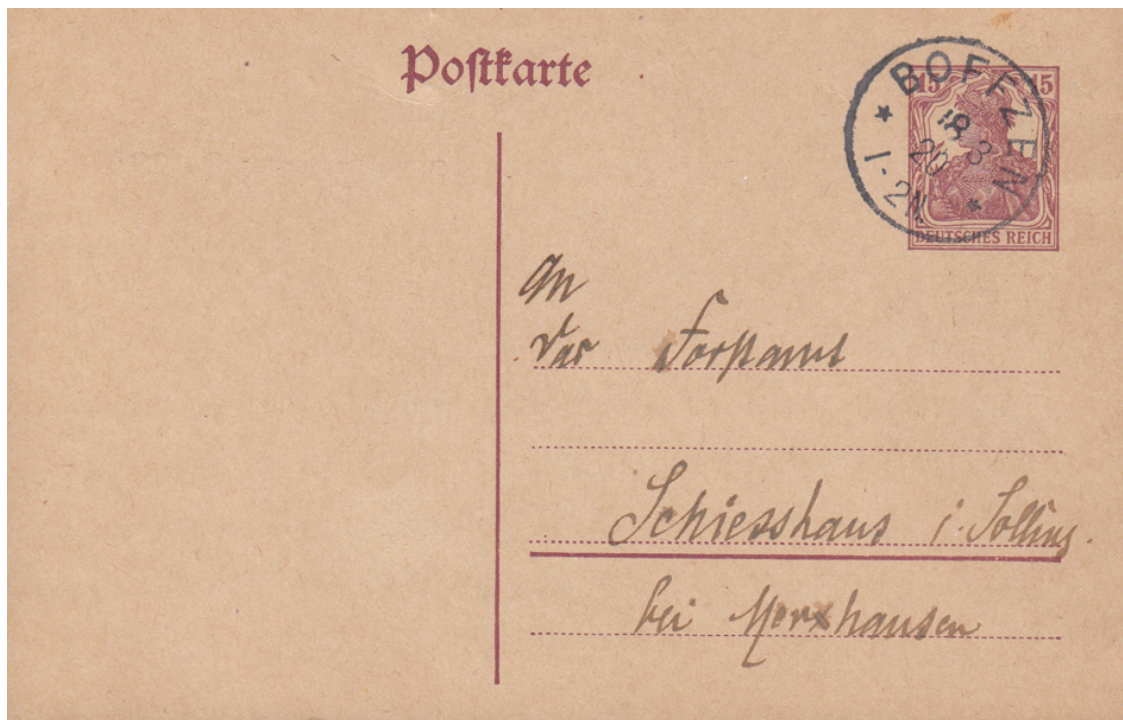
Fernpostkarte, P 116 I, 18.3.1920