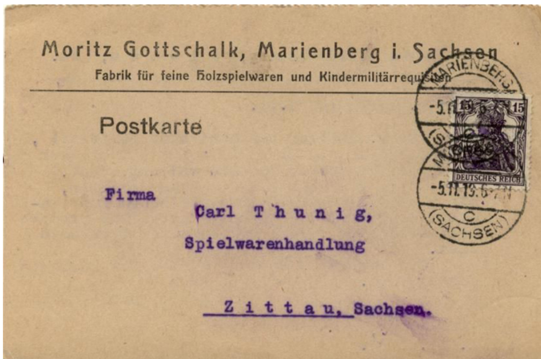
Fernpostkarte, 101, 5.11.1919

Für Fernpostkarten waren die 15 Pf. der normale Tarif.