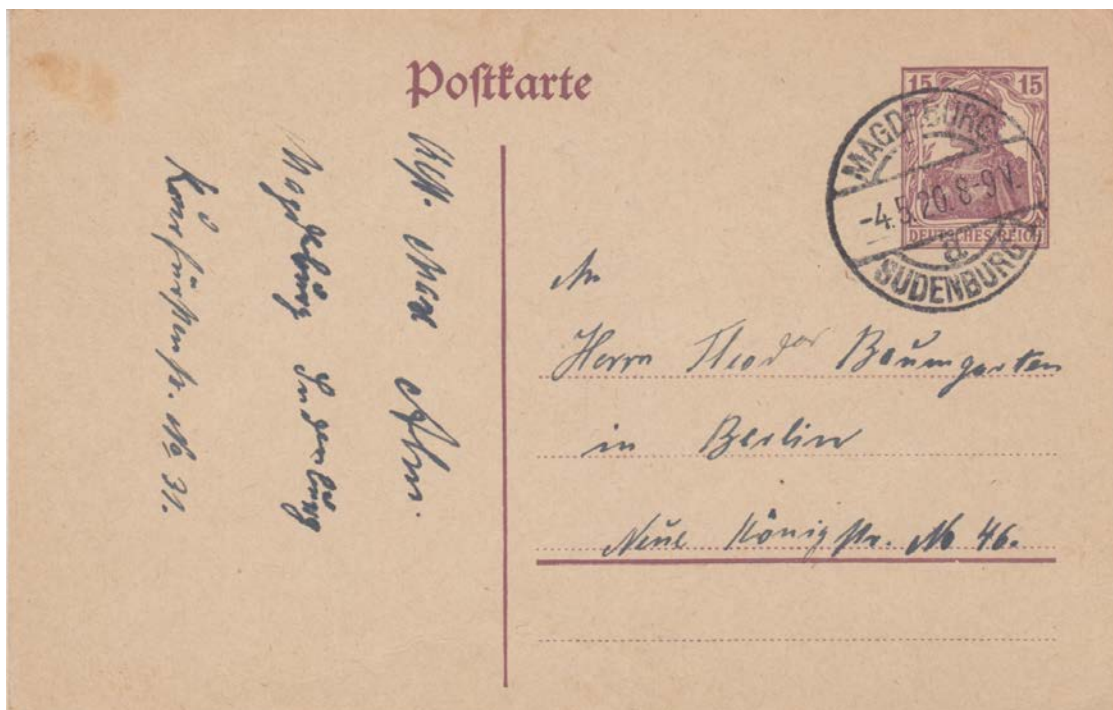
Fernpostkarte, P 116 I, 4.5.1920