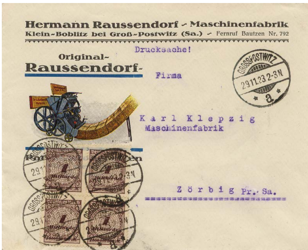
Drucksache bis 25g, 4x325 BP, 29.11.1923

Eine Drucksache, die einfach originell ist, einerseits visuell, andererseits durch die Ortsangabe des Absenders.