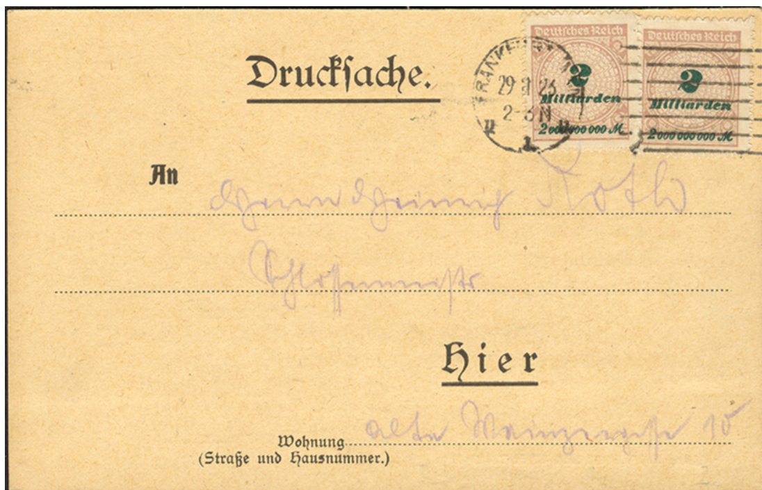
Drucksache bis 25g, 2x326 BP, 29.11.1923