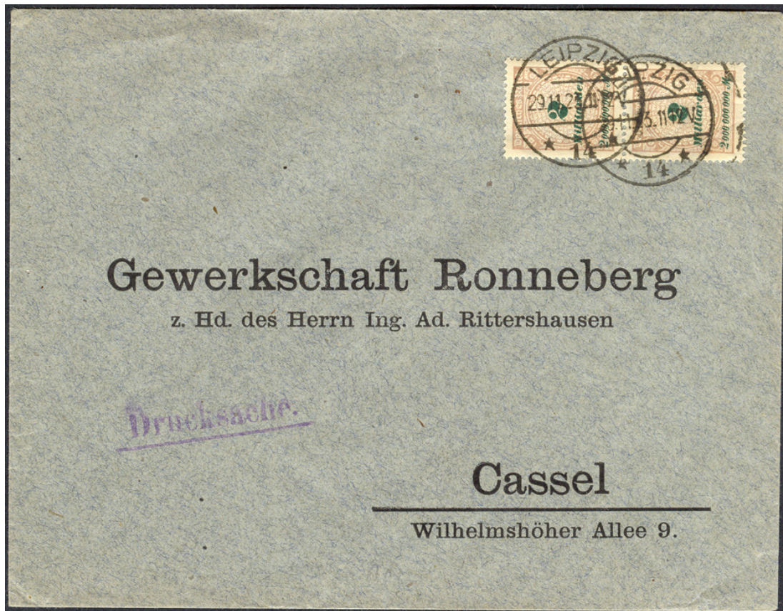
Drucksache bis 25g, 2x326 AP, 29.11.1923

Drucksachen bis 25 Gramm waren nun mit 16 Milliarden Mark zu bezahlen. Diese Marke wurde nun im Zweierpack der „Standard“ für einfach Drucksachen und Ortspostkarten.