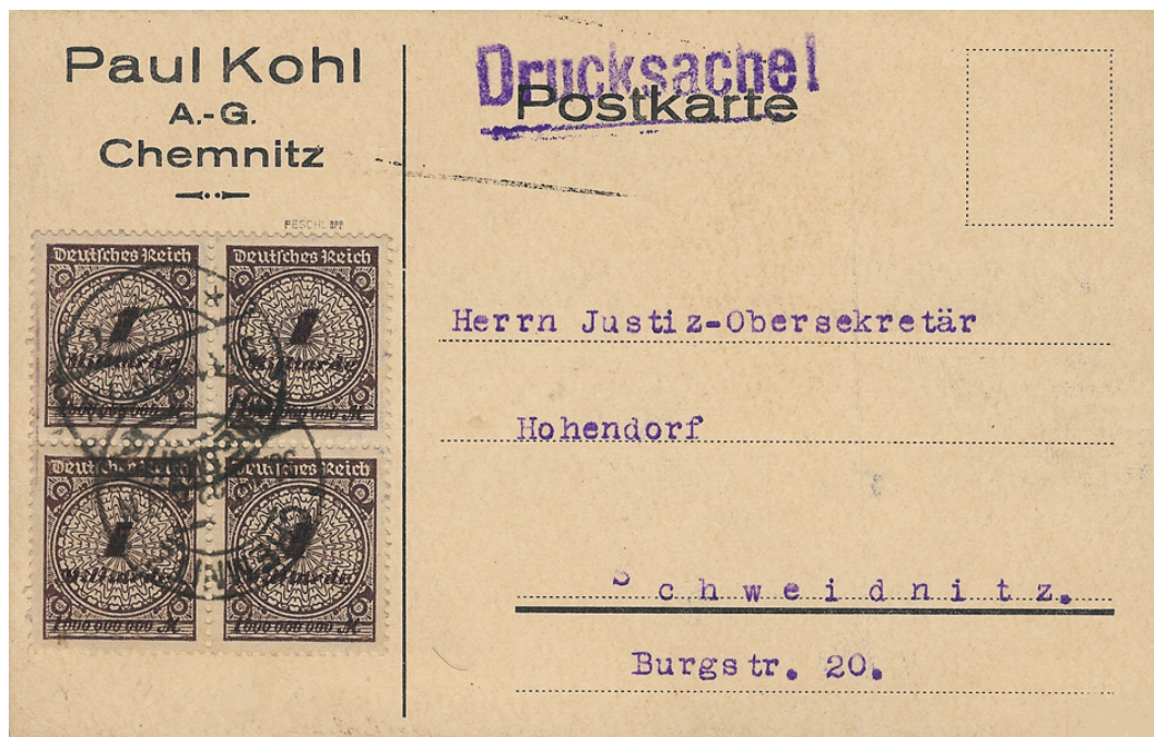
Drucksache bis 25g, 4x325 Wb, 30.11.1923, PP-Letztag

Ein Exemplar mit Marken der 325 AW in der b-Farbe wird auch immer wieder gerne genommen, sofern man über das nötige Kleingeld verfügt.