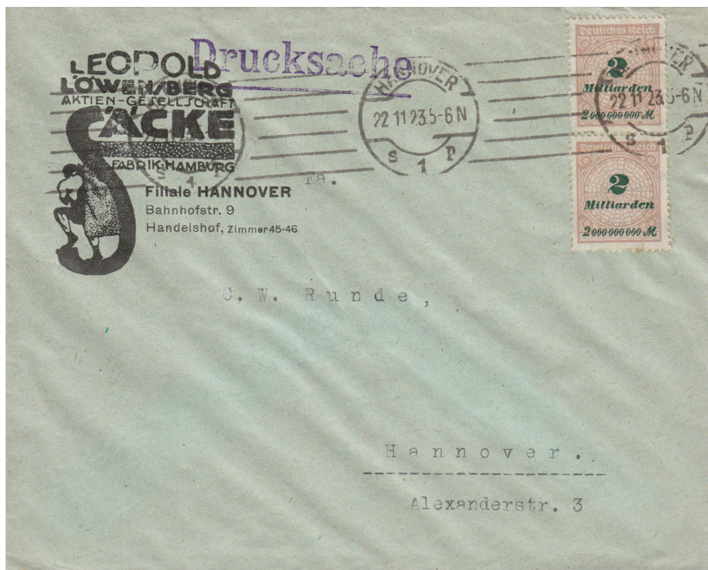
Drucksache bis 25g, 2x326 AW, 22.11.1923