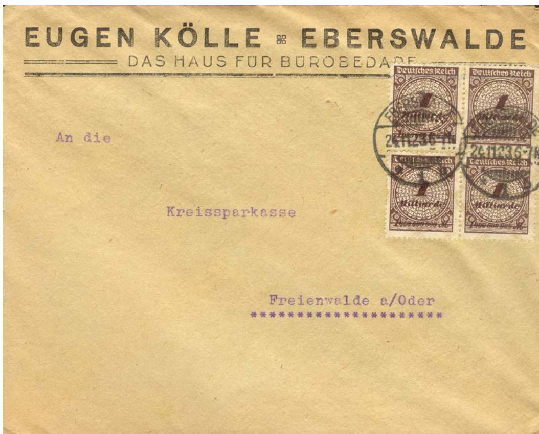
Drucksache bis 25g, 4x325 AWa, 24.11.1923

Das Drucksachenporto von 4 Milliarden konnte man mit dieser Marke gut abdecken.