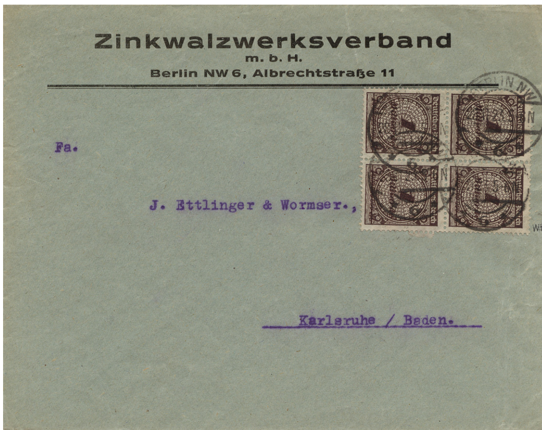
Drucksache bis 25g, 4x325 AWb, 22.11.1923

In der b-Farbe dann schon etwas Besonderes.