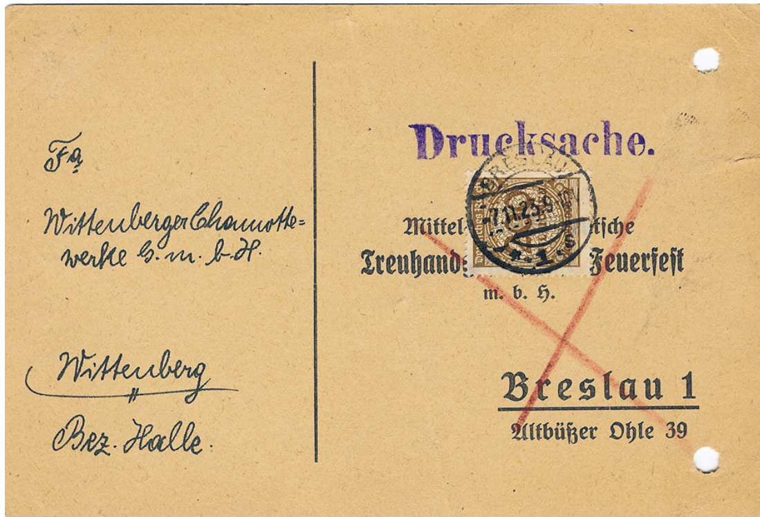
Drucksache bis 25g, 323 APb, 7.11.1923

Solch ein Stück mit einer 321 AP in der b-Farbe lässt man sich nur ungern entgehen.