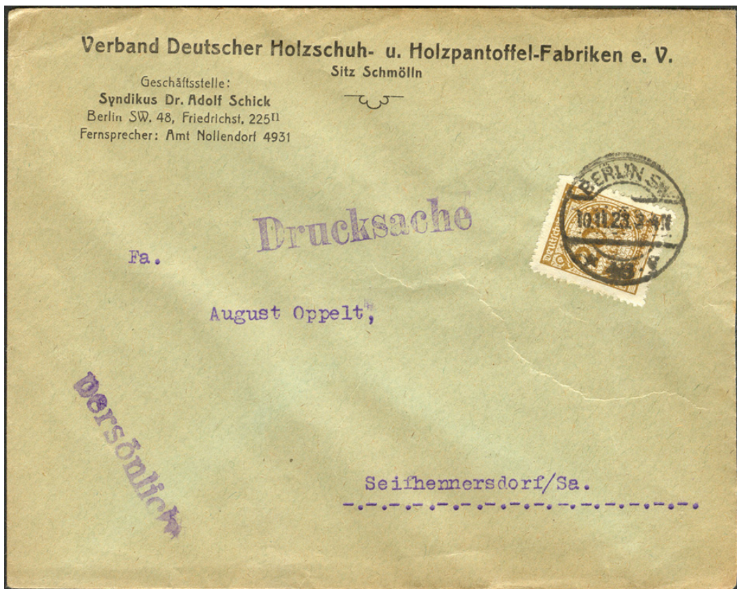
Drucksache bis 25g, 323 BP, 10.11.1923

Aber auch für Belege mit durchstochenen Marken der 200 Millionen muss man bei der Suche leider viel Geld aufbringen.