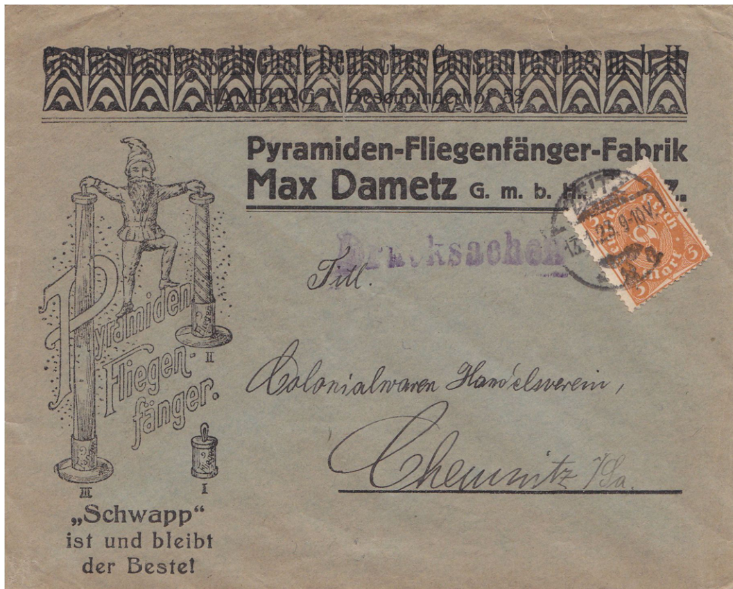
Drucksache, 218, 9.1.1923