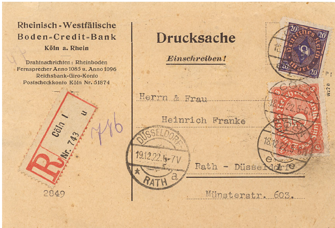
Drucksache, 194a + 207 P I, 18.12.1922

Nun ist eine Drucksache nichts Besonderes, aber eingeschrieben dann schon eher, obwohl es früher so etwas schon häufiger gegeben hat. Dafür waren dann zusätzlich 20 Mark zu entrichten und wenn es sich dann noch um eine MiNr. 207 P I handelt, ist der Beleg wieder eine Ringeltaube.