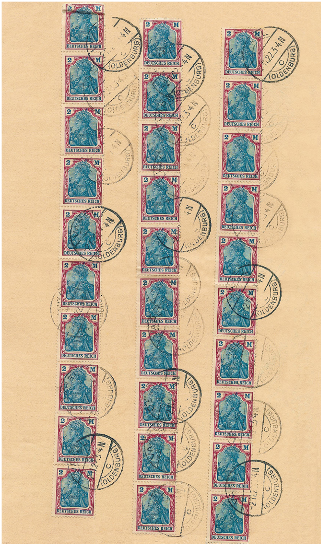
Telegrammformular, 30x152, 2.11.1922