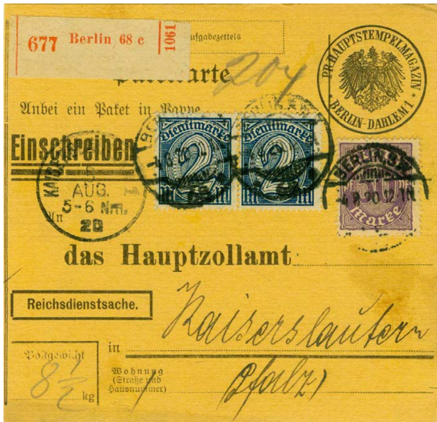
Paketkarte 8,5 kg, D29 + 2xD32, 4.6.1920

Hier einige Paketkarten mit Dienstmarken.