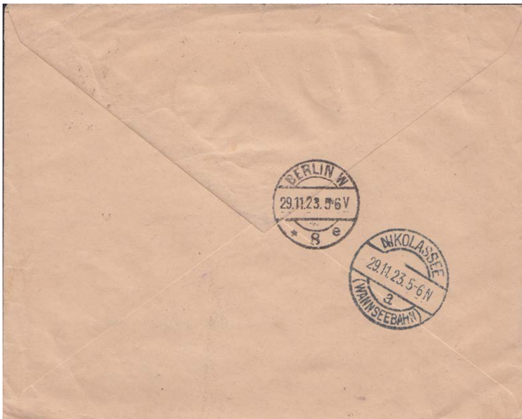
R-Ortsbrief, 3x328 AP, 28.11.1923