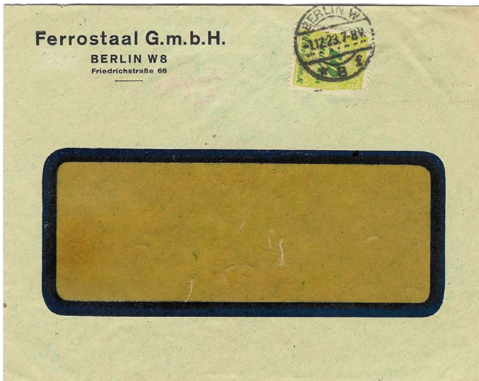
Ortsbrief bis 20g, 328 AW, 1.12.1923

Beim folgenden Beleg handelt es sich um einen „Überläufer“. Der Brief wurde bereits am 30.11. in das Dunkel des Briefkastens befördert. Nach der ersten Leerung am nächsten Tag kam er unter den Stempel und da bekanntlich auf den 30.11. der 1.12. folgt, trägt er eben dieses Datum. Hierbei handelt es sich also um eine „Novemberfrankatur“.