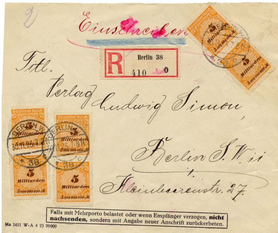
R-Ortsbrief, 6x327 BP, 30.11.1923, PP-Letztag

Eingeschriebene Ortsbriefe stellen schon kleine Raritäten dar und man findet solche auch meist nur von großen Städten.