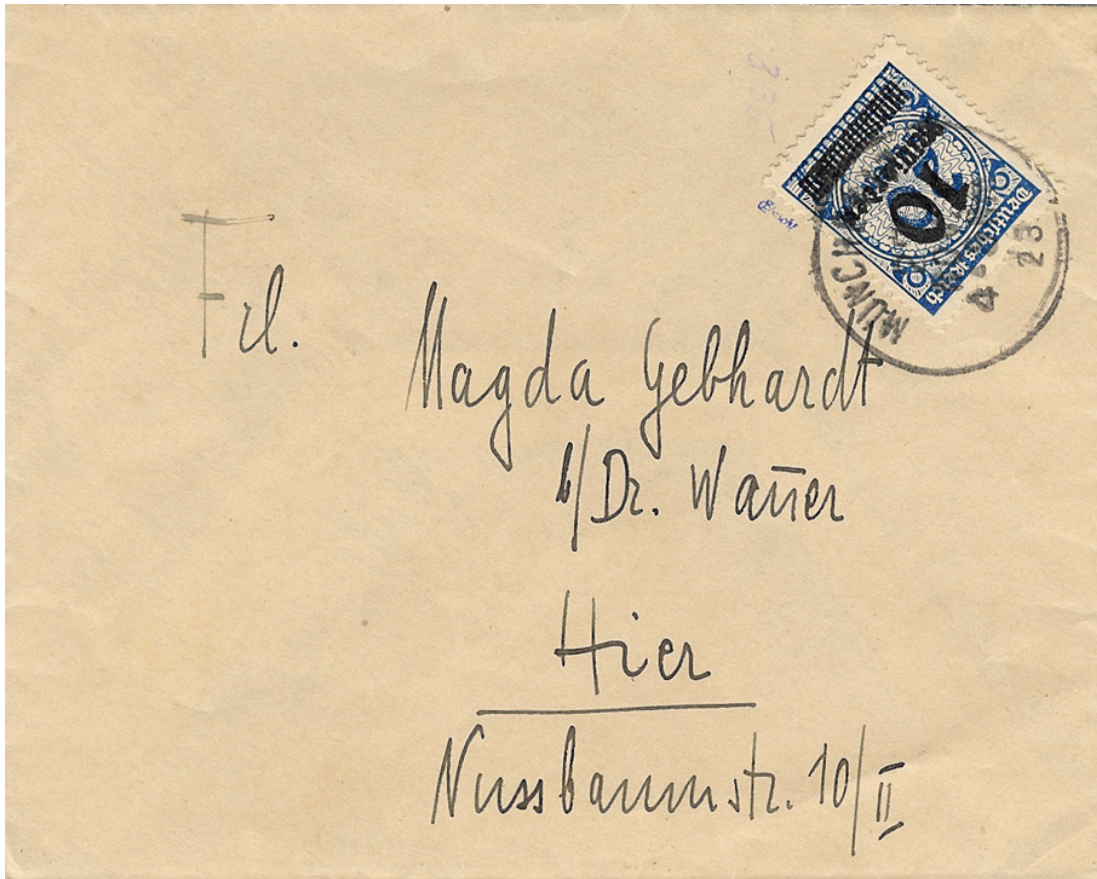
Ortsbrief bis 20g, 335 AP, 27.11.1923

Eingeschriebene Ortsbriefe stellen schon kleine Raritäten dar und man findet solche auch meist nur von großen Städten.