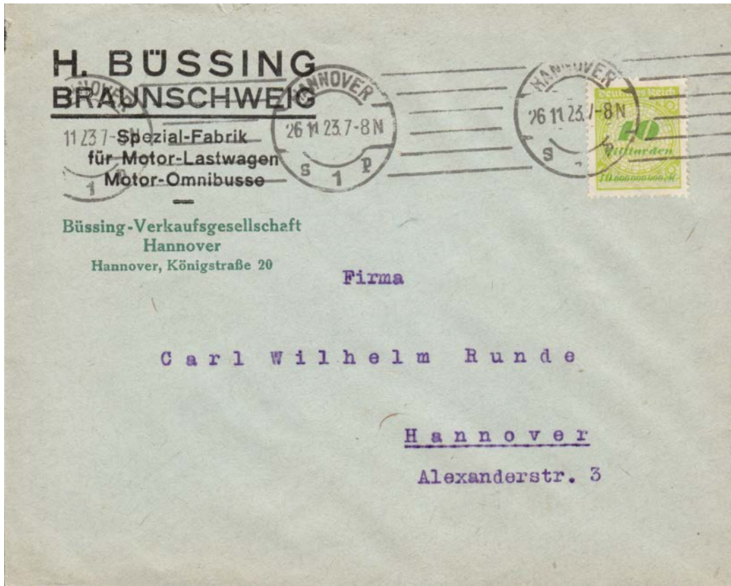
Ortsbrief bis 20g, 328 AP, 26.11.1923, PP-Ersttag

Ortsbriefe kosteten nun 40 Milliarden Mark.