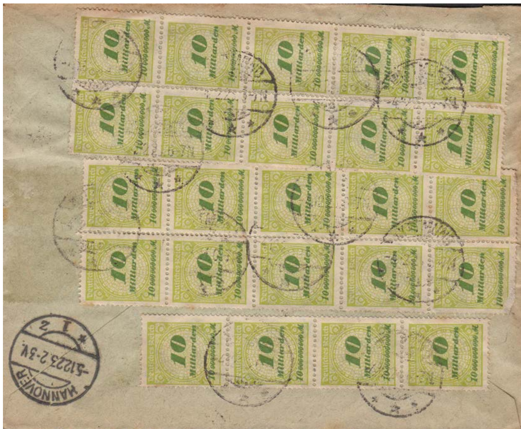
R-Fernbrief bis 20g, 30x328 AP, 4.12.1923