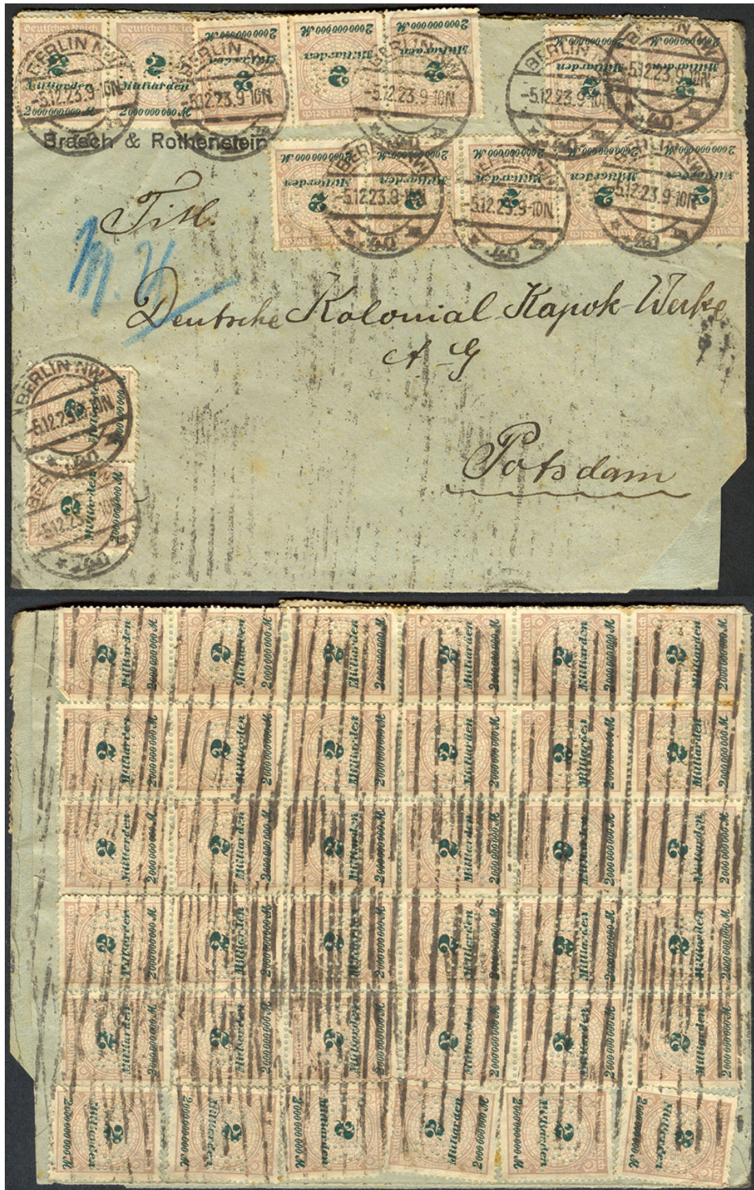
Fernbrief bis 20g, 50x326 AW, 5.12.1923

Nun waren für den Fernbrief bis 20 Gramm 10 Pfennig bzw. 100 Milliarden Mark zu bezahlen. Und selbstverständlich finden wir auch wieder den Aufbrauch „kleiner“ Werte. Hier eine reine Mehrfachfrankatur.