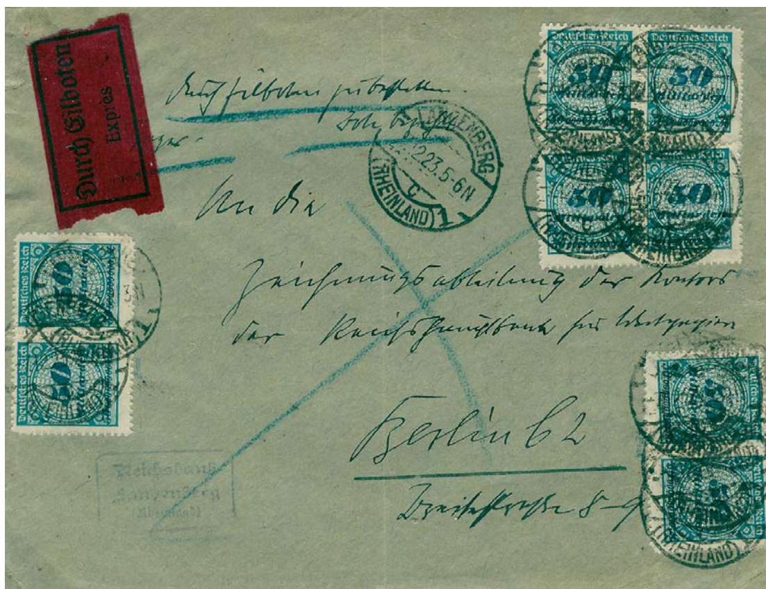
Eil-Fernbrief bis 20g, 6x330 BP, 7.12.1923

Und wenn der Brief es eilig hatte waren 300 Milliarden Mark (30 Rentenpfennig) an Gebühr für die Eilzustellung fällig.