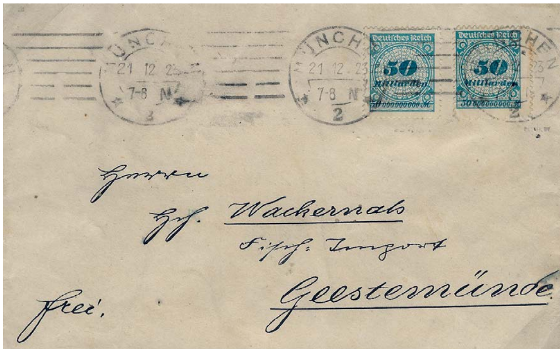
Fernbrief bis 20g, 330 AP + 330 BP, 21.12.1923

Apart hier die Kombination der Marken gezähnt und durchstochen.