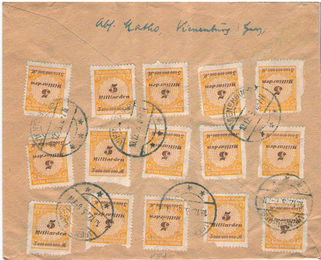
Fernbrief bis 20g, 20x327 BP, 10.12.1923