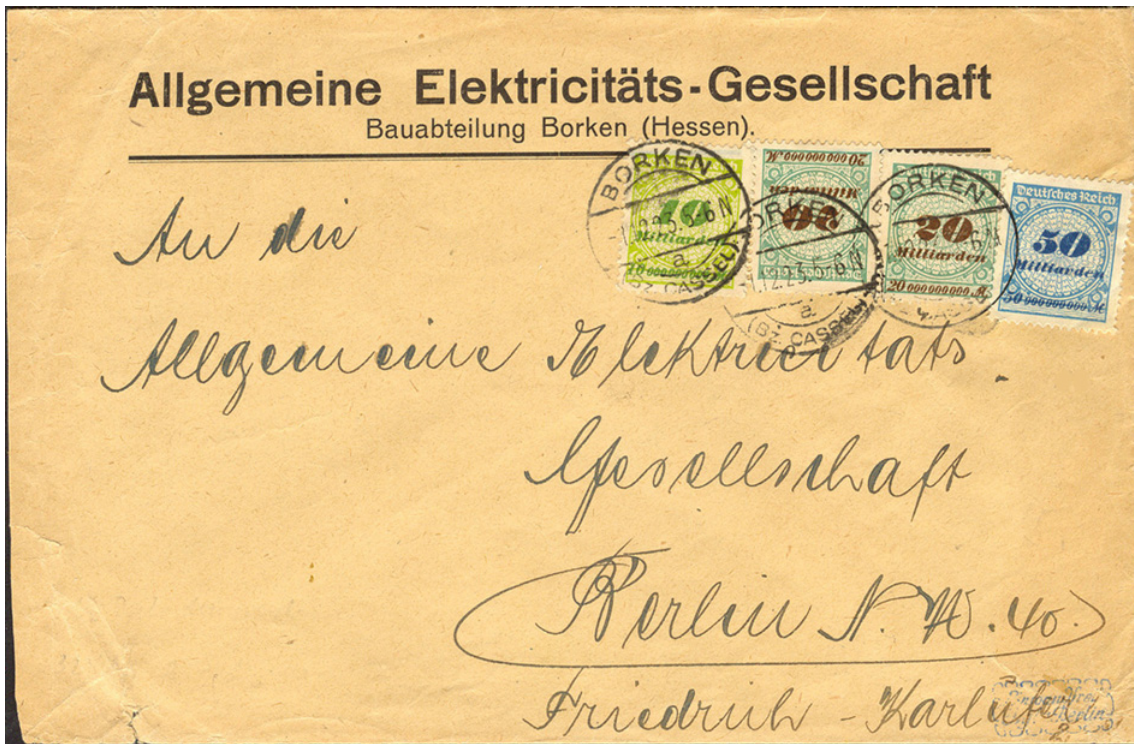
Fernbrief bis 20g, 328 AP + 2x329 AP + 330 AP, 1.12.1923, PP-Ersttag

Und noch ein leicht berechenbares Porto vom 1.12.1923.