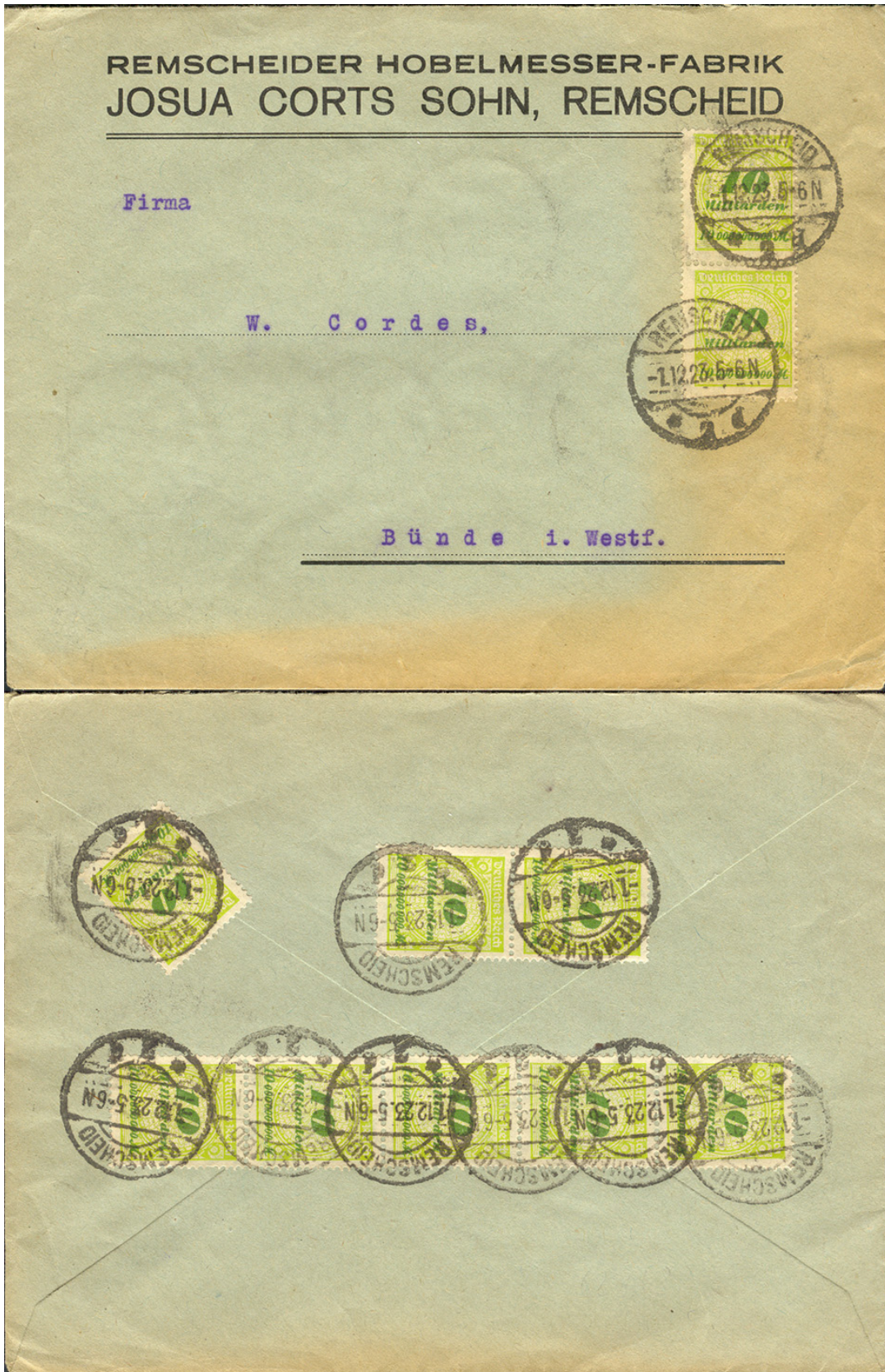
Fernbrief bis 20g, 10x328 AP, 1.12.1923, PP-Ersttag

Nachstehend einige „lupenreinen“ Dezemberfrankaturen mit 100 Milliarden = 10 Rentenpfennig für den einfachen Fernbrief bis 20g.