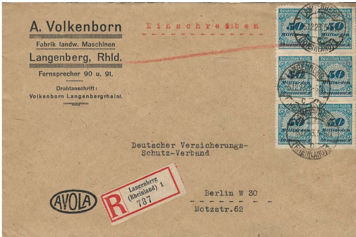
R-Fernbrief bis 20g, 6x330 BP, 5.12.1923

Und wenn der Brief es eilig hatte waren 300 Milliarden Mark (30 Rentenpfennig) an Gebühr für die Eilzustellung fällig.