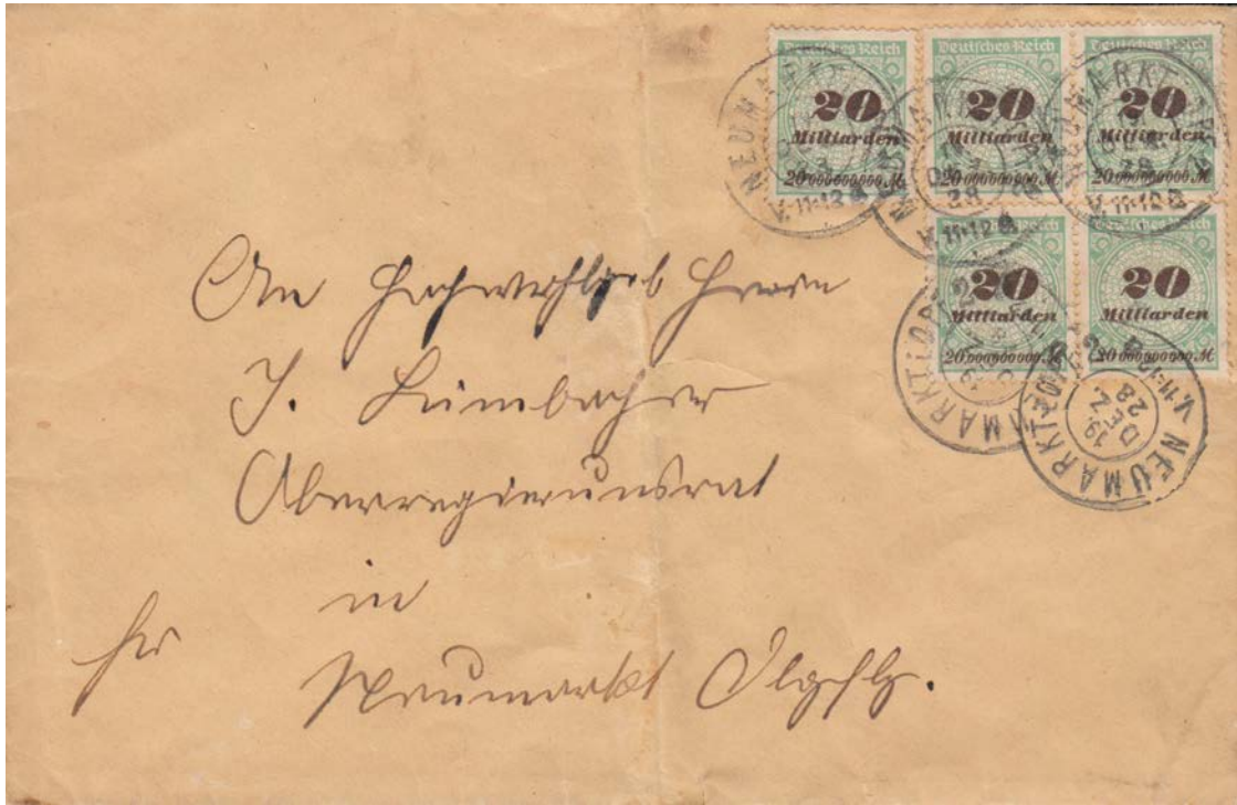
Fernbrief bis 20g, 5x329 AW, 19.12.1923