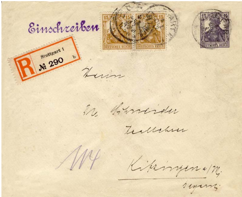
Ein eingeschriebener Brief, freigemacht mit mehreren Exemplaren des Zusammendrucks S 12b, also den Marken aus dem Wertzeichengeber. Ein Fernbrief bis 250g kostete 25 Pfennig und die Einschreibgebühr 20 Pfennig, also insgesamt 45 Pfennig.