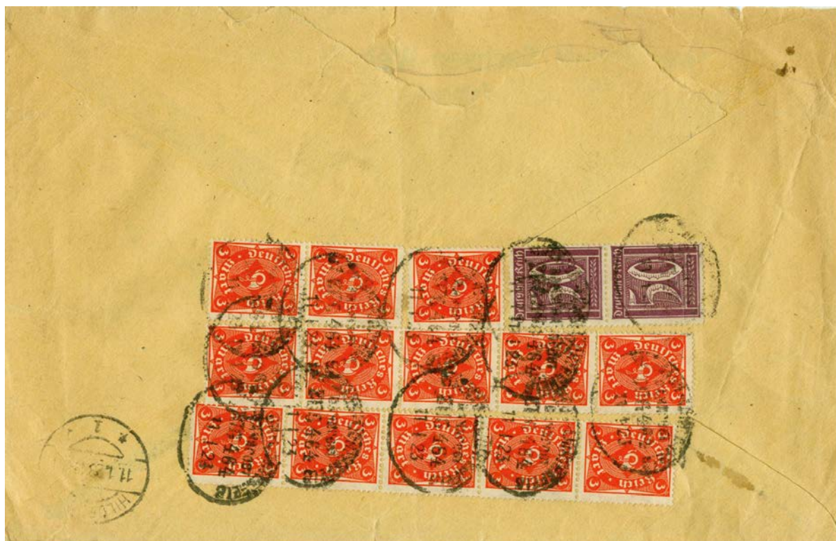
R-Fernbrief bis 100g, 2x183 +18x225, 11.1.1923