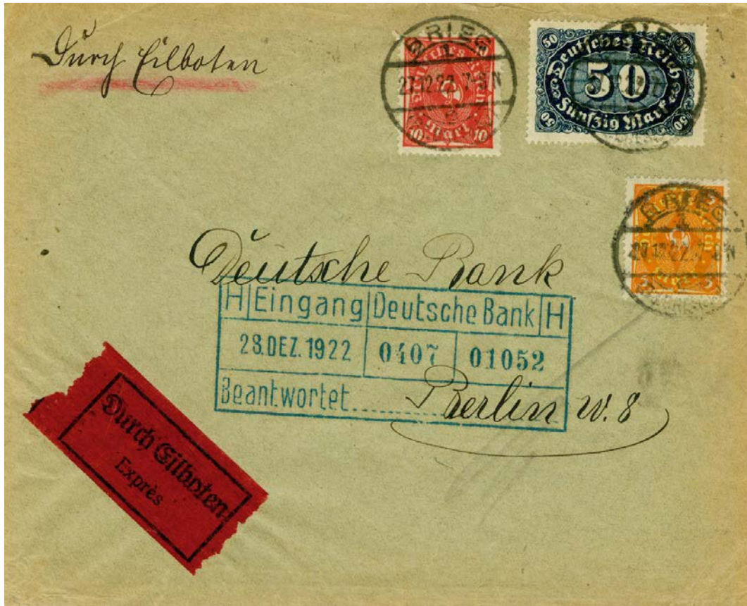
Eil-Fernbrief bis 100g, 205 +206 + 246, 11.1.1923

Und wenn es schnell gehen sollte, musste für die Eilzustellung 30 Mark bezahlt werden.