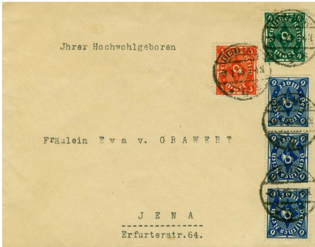
Fernbrief bis 20g, 225 + 226 + 3x228, 3.1.1923

Nun waren bereits 25 Mark für einen einfachen Fernbrief zu entrichten. Da es keine Marke zu 25 Mark gab, war nur Frankierung als Bunt-, Mehrfach- oder Mischfrankatur möglich.