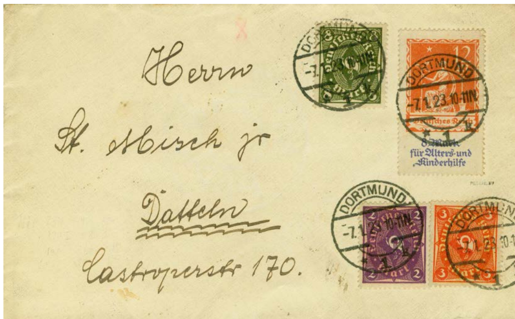
Fernbrief bis 20g, 191 + 192 + 229 + 234, 7.1.1923