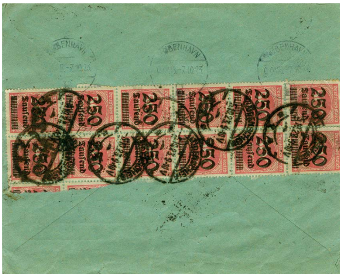
Auslandsbrief bis 20g, 24x295, 5.10.1923