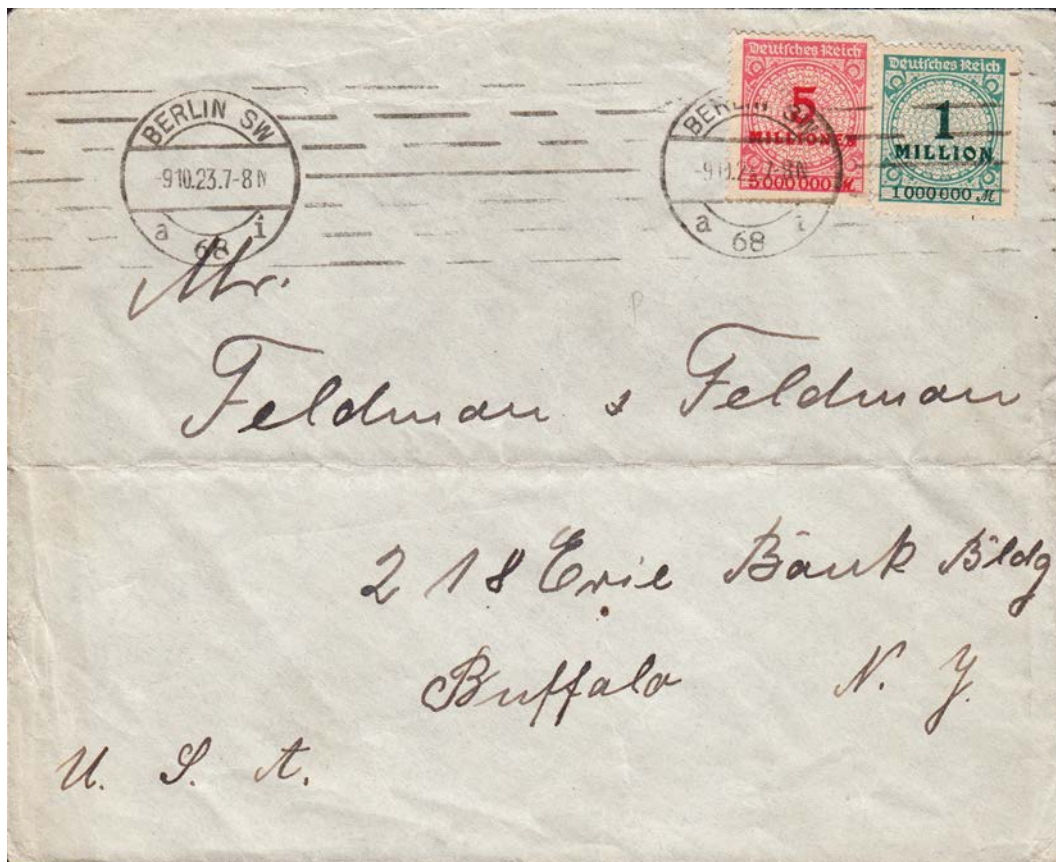
Auslandsbrief bis 20g, 314AP + 317 AP, 9.10.1923 (PP-Letzttag)

Bei dem nachstehenden Brief handelt es sich um eine Frühverwendung der Rosettenmarken, denn solche wurden eigentlich erst in der folgenden Portoperiode ab dem 10. Oktober benötigt.