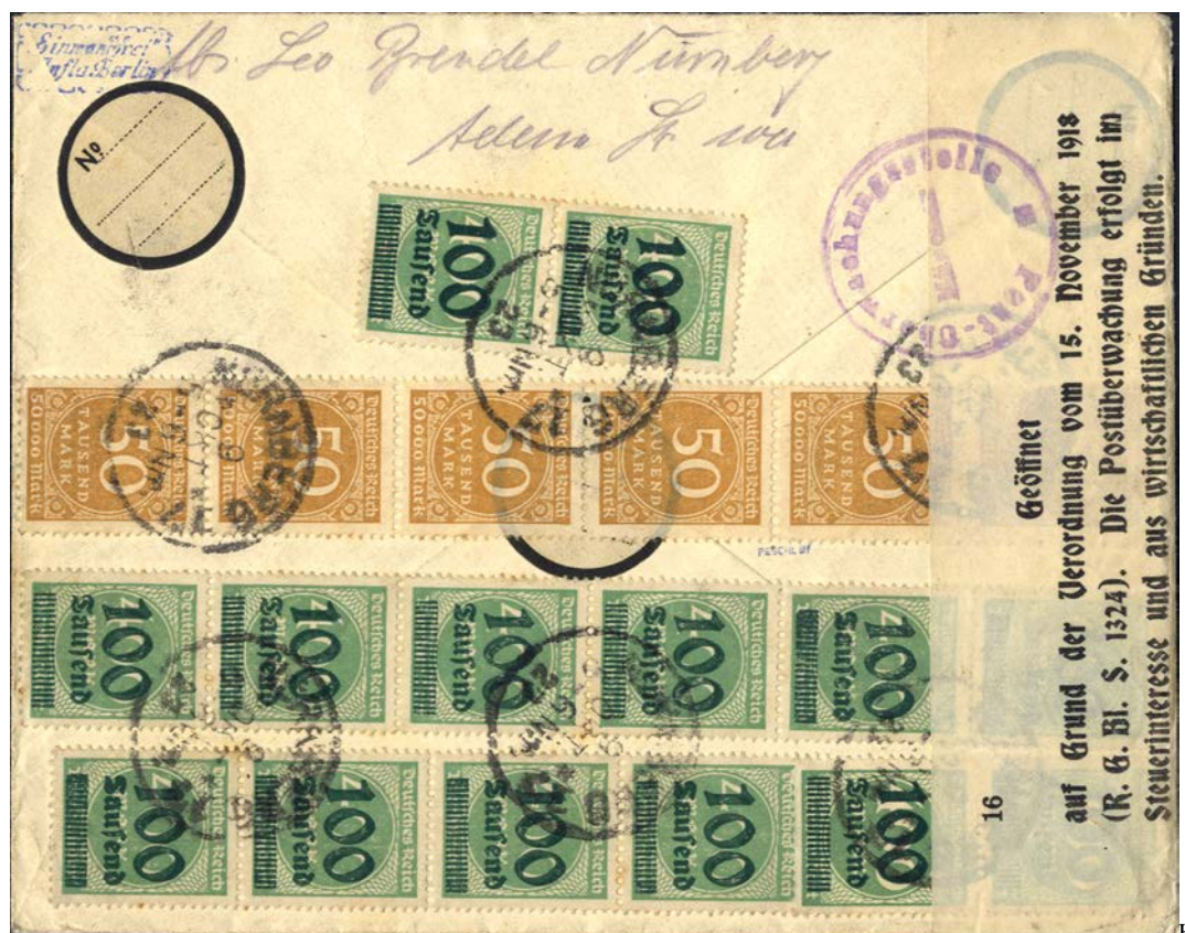
R-Auslandsbrief bis 20g, 6x275a + 19x290 + 295 + 2x304, 9.10.1923 (PP-Letztag)