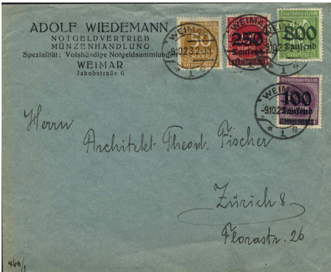
Auslandsdrucksache bis 50g, 275a + 289b + 295 + 302, 9.10.1923 (PP-Letzttag) HM

Aber ein Exemplar mit Freimarken ist ebenfalls vorhanden, schön bunt frankiert und aufgrund des Absenders vermutlich wohl auch philatelistisch beeinflusst.