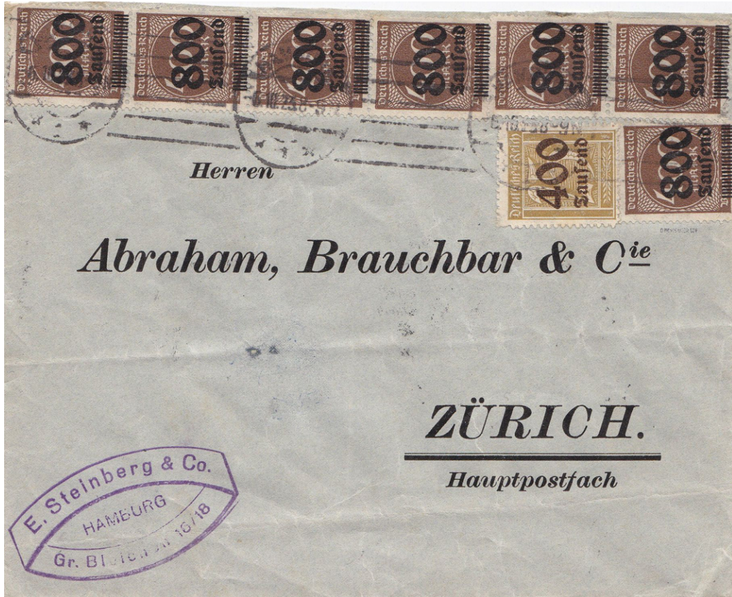
Auslandsbrief bis 20g, 298 +7x305, 6.10.1923